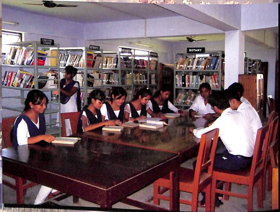
ব্যস্ত শিক্ষার্থী : কেন্দ্ৰীয় পুথিভঁৰালত