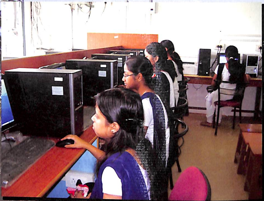
কলেজৰ সদাব্যস্ত কম্পিউটাৰ লেবৰেটৰী .....