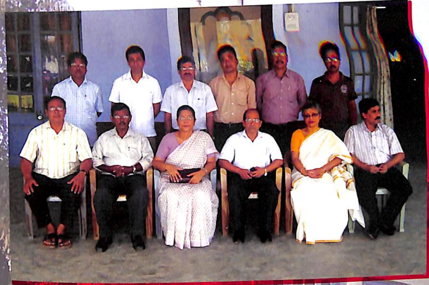
উদ্যাপন সমিতিৰ বিষয়ববীয়া শিক্ষকৰ একাংশ