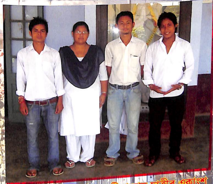
উদ্যাপন সমিতিৰ বিষয়ববীয়া ছাত্ৰ-ছাত্ৰীৰ একাংশ