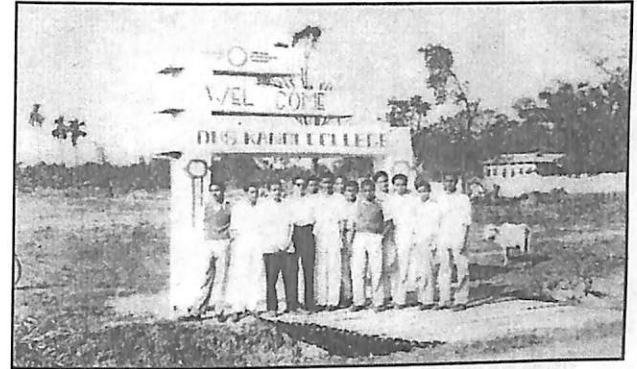
১৯৫৫ চনৰ কলেজৰ ৰূপ