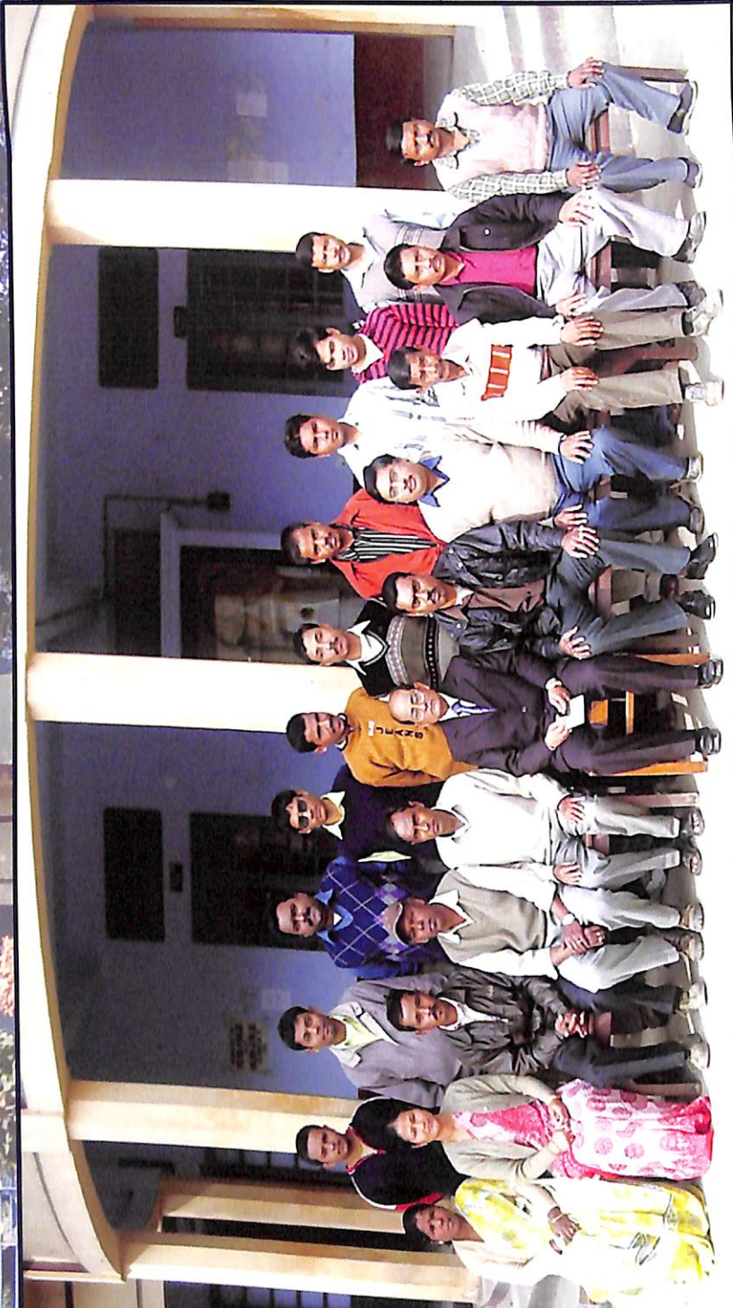
কলেজৰ কাৰ্যালয়ৰ কৰ্মচাৰীসকলৰ কেইজনমান .....