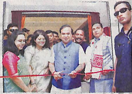
নাট্য-সাহিত্যত সতী জয়মতী